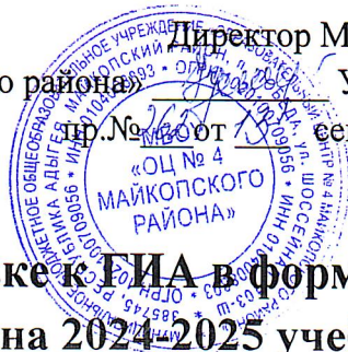
График консультаций по подготовке к ГИА в форме ЕГЭ учащихся 11 класса МБОУ «ОЦ №4 на 2024-2025 учебный год